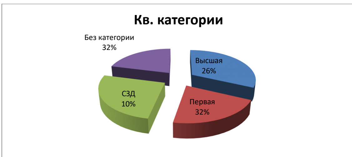
Диаграмма динамики профессионального роста квалификации педагогов ДОУ