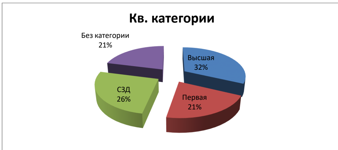
Диаграмма динамики профессионального роста квалификации педагогов ДОУ