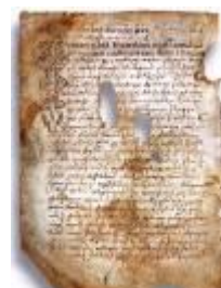
Псковская судная грамота

Двинская уставная грамота 1397 года. Мздоимство упоминается в русских летописях XIV века, например в Двинской уставной грамоте 1397 года в статье 6: «А самосуда четыре рубли, а самосуд то: кто изыснав татя с поличным, да отпустит, а себе посул возьмет, а наместники доведаются по заповеди, ино то самосуд, а опричь того самосуда нет». Там же, в статье 8: «...а черес поруку не ковати, а посула в железех не просити; а что в железех посул, то не в посул».