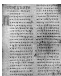
Двинская уставная грамота

Лихоимец – жадный вымогатель, взяточник».