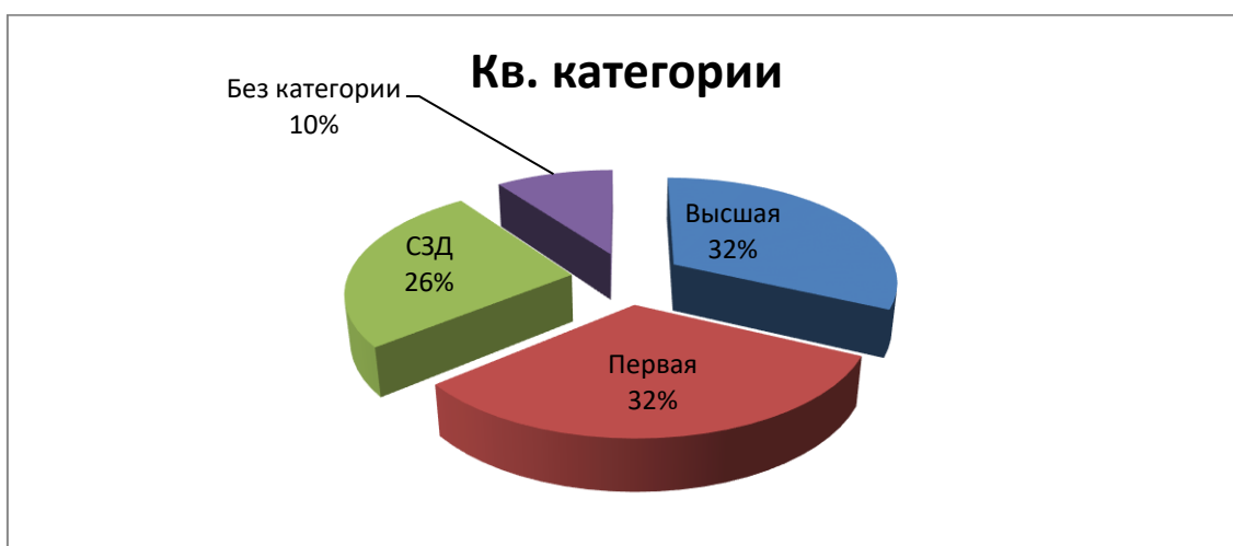
Диаграмма динамики профессионального роста квалификации педагогов ДОУ