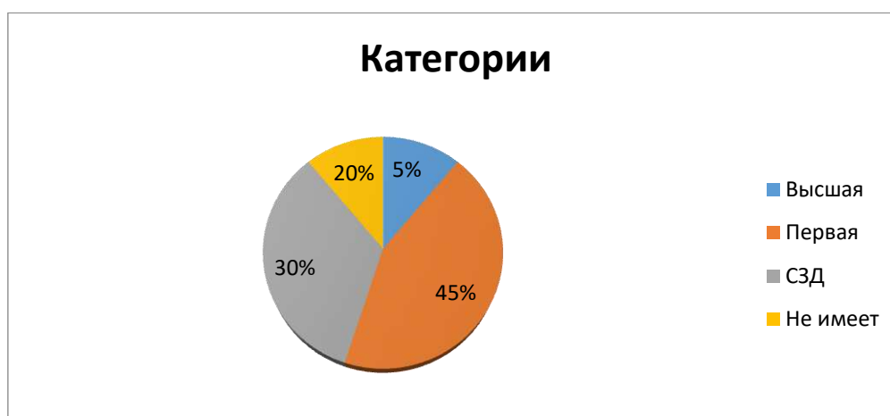
Диаграмма динамики профессионального роста квалификации педагогов ДОУ